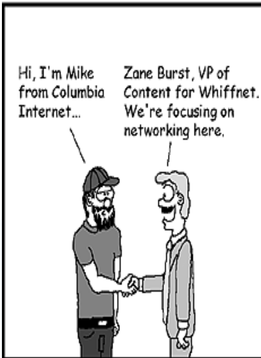
USER FRIENDLY by Illiad

Really? Cool! So are you guys going to cover TCP/IP, packet theory, security, topologies, IPv6, NIC selection or what? Something new perhaps?